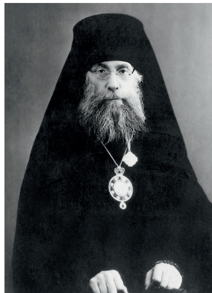
Епископ Вениамин (Миров)

Одна из главных духовных задач Великого поста – помочь человеку задуматься о своей жизни, увидеть свои недостатки и с Божией помощью