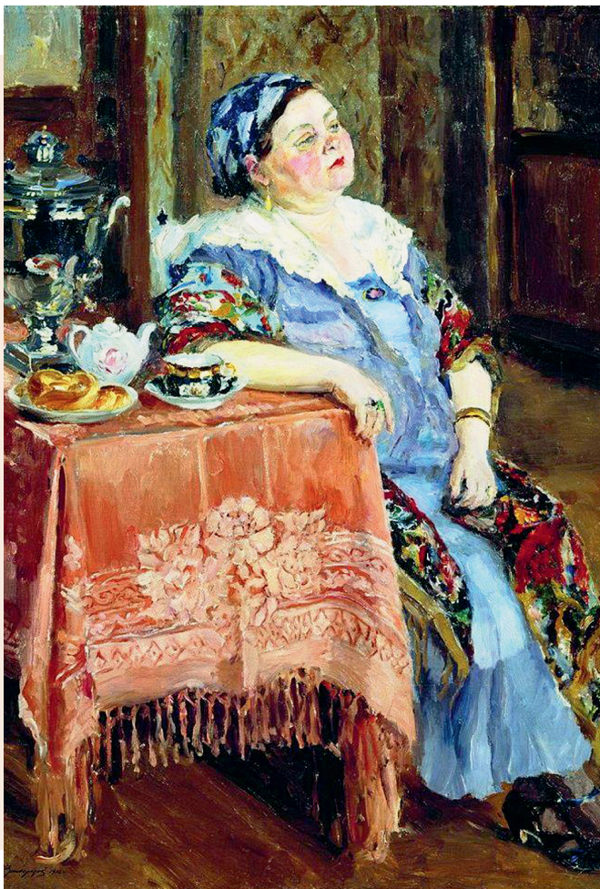
С. Виноградов. Купчиха за самоваром.

Дело-то понятно: доктора образованны и в благочестивых делах ничего не понимают.